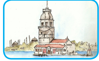
Tarihi Gezilecek Yerler