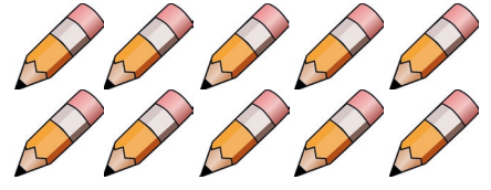
Bir deste kalem